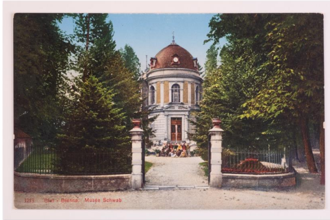
Carte postale, avant 1945

Postkarte, vor 1945