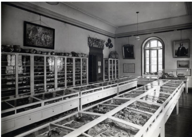
Collection d'art, étage supérieur salle sud, avant 1945

Postkarte, vor 1945