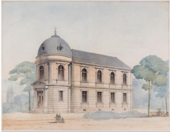
Aquarelle de Friedrich Ludwig von Rütte, 1870, Département des constructions de la ville de Bienne